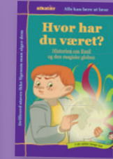
T til række-tunge-lyd