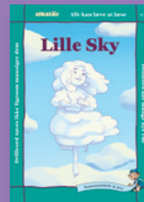
K til G