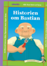
T til D