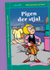
G til J