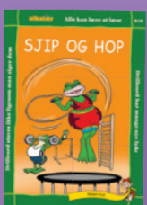
Sjippe-lyd (kun sj)